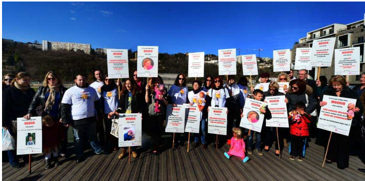
■ Les parents de différentes associations, réunis sur la passerelle, avant de lancer leurs poupées à l'eau.

Soins. C'est un message très fort qui a été lancé, hier (mercredi 12 février), à l'encontre des politiques, à l'aube de la Journée internationale du cancer de l'enfant, ce samedi.